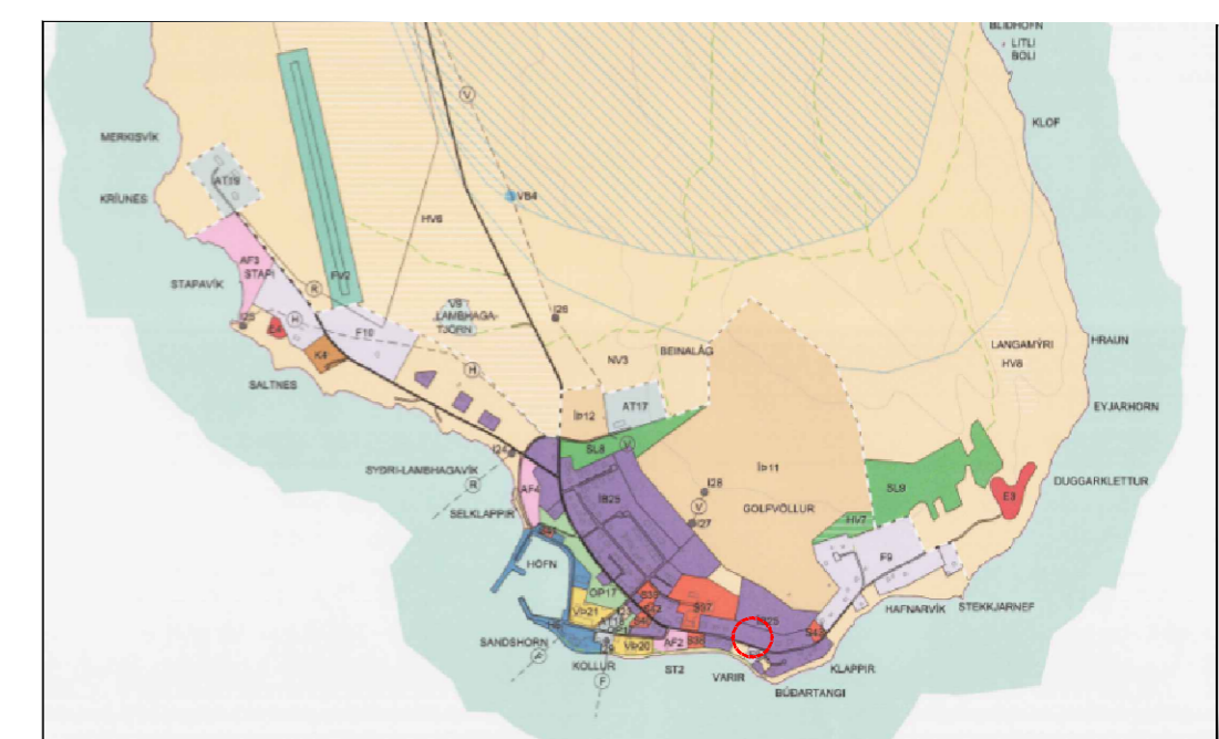
Aðalskipulag Akureyrar 2018 - 2030 - mkv. 1:10.000