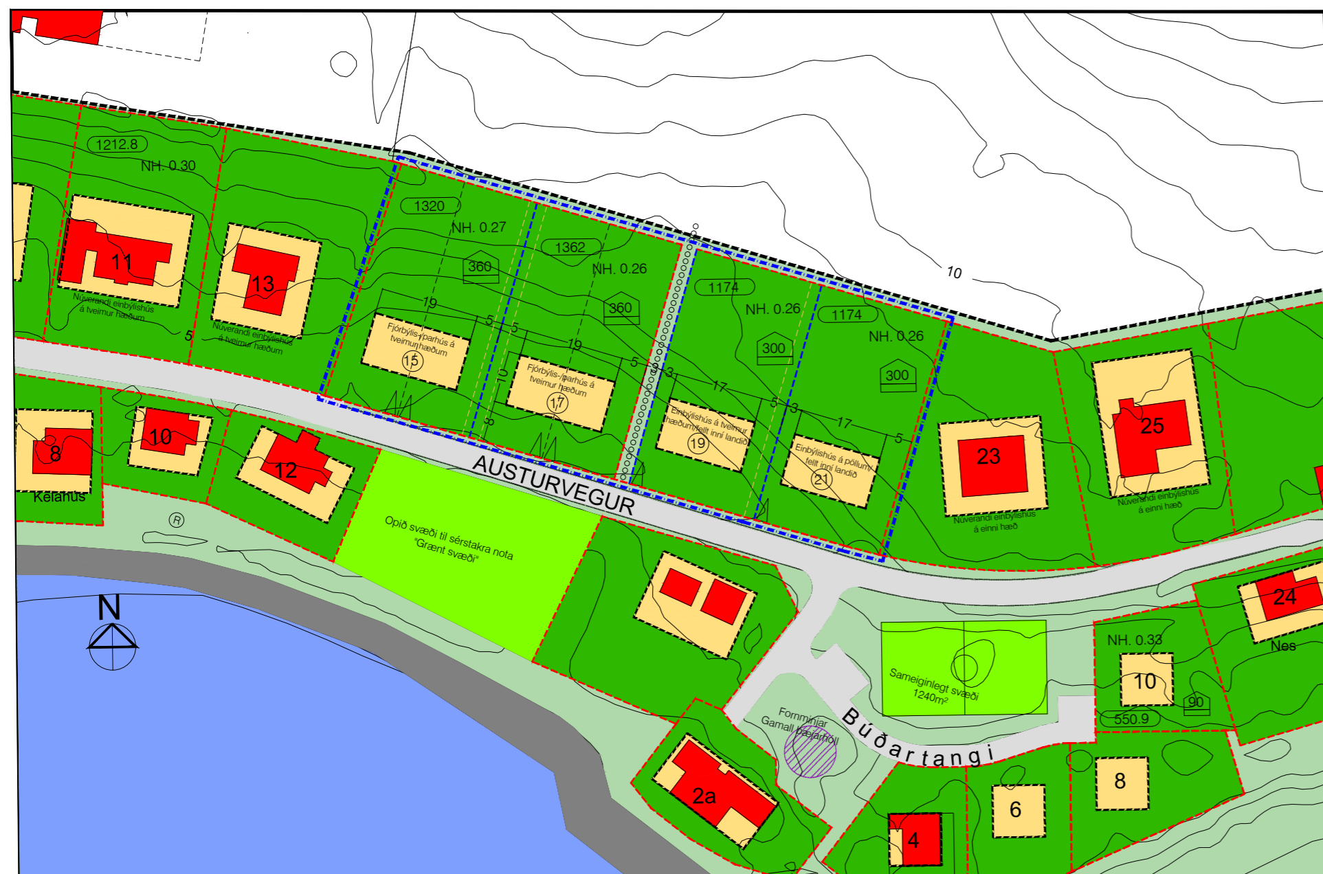
Tillaga deiliskipulagsbreytingu á Austurvegi 15, 17, 19 og 21 - mkv. 1:1000